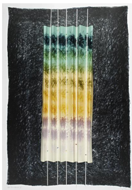
Eduardo Iglesias. Barcelona 2, 1994. Colagem. Acervo dos Palácios

Vamos fazer uma obra de arte usando a técnica do mosaico? Pode ser feito com diferentes materiais e superfícies. É só seguir as instruções!